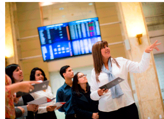
Explicación de las pantallas de negociación bursátil