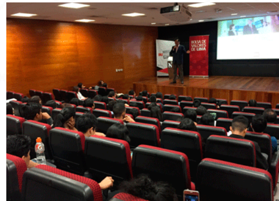
Charla sobre el mercado de capitales y la BVL