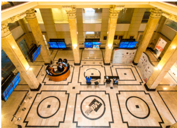
Tour en el hall del edificio histórico de la BVL