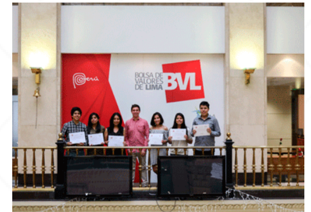
Fotos en el balcón donde se realizan los tradicionales campanazos